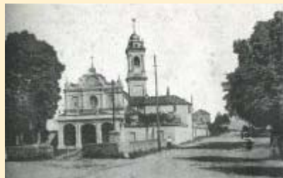
Piazza Madonna delle Grazie - il vecchio cimitero

Dalla caduta dell'impero all'anno mille il territorio volpianese è teatro delle alterne vicende: dapprima le invasioni di popolazioni germaniche, tra queste i Longobardi a cui forse si deve il primo insediamento fortificato sulla punta estrema della Vauda, poi, dopo la sconfitta inflitta a questi ultimi da Carlo Magno e la conseguente riorganizzazione del territorio, Volpiano diviene parte della Marca d'Ivrea.